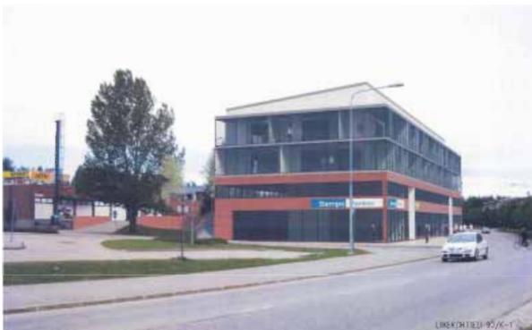
Havainnekuva korttelin 90 asemakaavamuutoksen valmisteluaineistosta (P & R Arkkitehdit Oy).