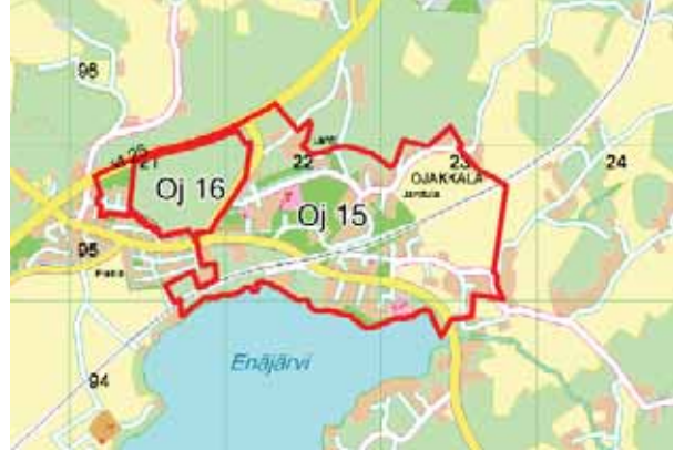
Ojakkalan asemakaavoituskohteet. Kartassa on esitetty ohjeellisina rajauksina vuonna 2012 vireillä olevat ja vireille tulevat asemakaavat (punainen yhtenäinen viiva).