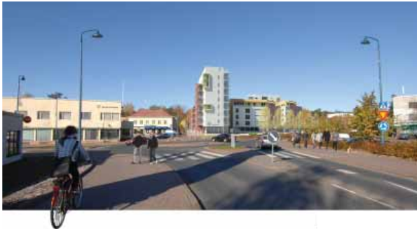
Havainnekuva keskustan asemakaavamuutoksen valmisteluaineistosta (Arkkitehdit Ingervo Consulting Oy).