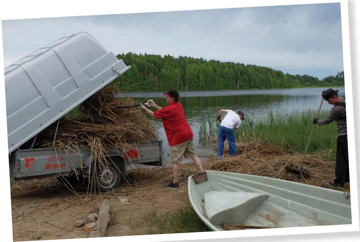
Painatus: Karkkilan Painopalvelu Oy marraskuu 2014