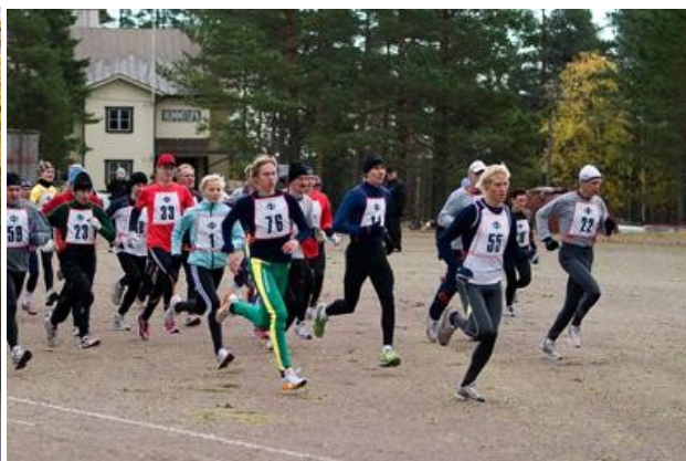
Ensimmäinen Vihtijärvi-hölkä juostiin 1969.