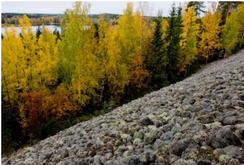
Ylimmäisenjärven muinaisranta.

Jääkauden jälkeinen Baltian jääjärvi peitti Vihtijärven aluetta noin 11 000 vuotta sitten. Vain Rokokallion huippu oli vedenpinnan yläpuolella. Yoldiamerivaiheen alkaessa 10 200 vuotta sitten alue paljastui suurimmaksi osaksi, eikä vesi enää peittänyt sitä. Ensimmäiset ihmiset alueelle saapuivat 9 000 vuotta sitten. Merkit ensimmäisestä vakituisesta asutuksesta ajoittuvat kuitenkin vasta ajalle 2500 – 1500 eAa. Kiinteän asutuksen Vihti sai keskiajalla. Vihtijärven neljännekunnan muodostivat myöhäiskeskiajalla neljä kylää: Vanhakylä, Niemi, Veirlä ja Hiiskula. 1500-luvun loppuun mennessä kylien taloluku oli noussut 11 taloon.