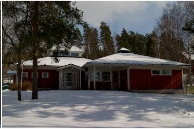
Päiväkoti rakennettiin 1987 monitoimitaloksi.