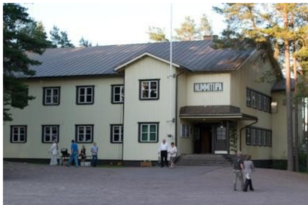
Nummitupa on valmistunut vuonna 1954.

Hiiskulan mailla ovat uimaranta, Rokoladun pohja ja Rokokota sekä pururata Nummituvan ympäristössä.