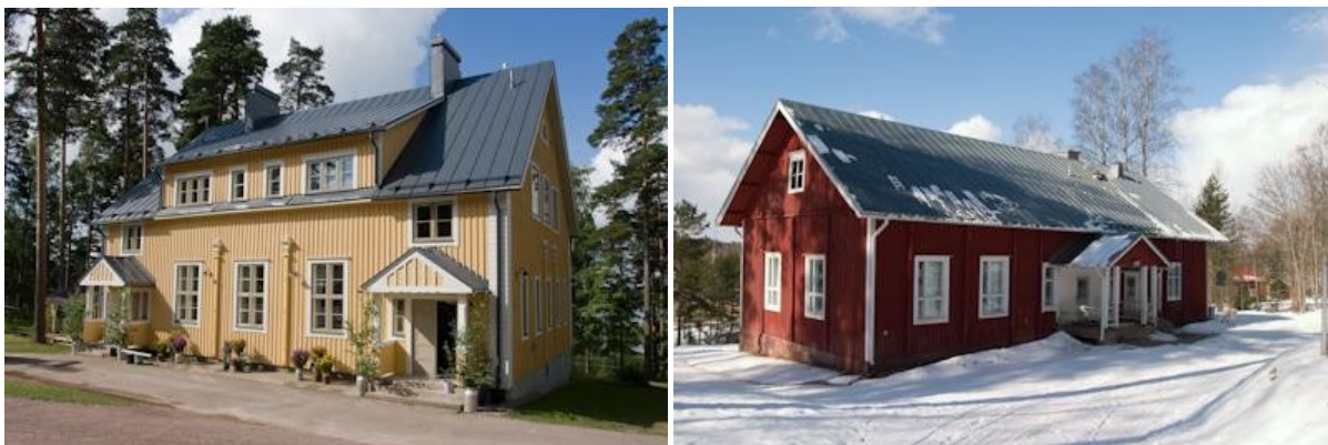
Vihtijärven koulu- ja kylätalo avajaispäivänä 1.8.2009. Alakoulu on myös käytössä.

Koulun vanhempainyhdistys on järjestänyt vuoden 2008 syksystä lähtien iltapäivätoimintaa koululaisille. Toiminta on osittain kunnan tukemaa. Lukuvuonna 2010-2011 ip-toimintaa on viitenä päivänä viikossa, lapsia ryhmässä on 12. Lisäksi vanhempainyhdistys järjestää kerran viikossa ELY-keskuksen tukemaa ip-kerhoa.