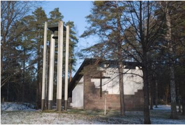
Vihtijärven kappeli valmistui 1961.