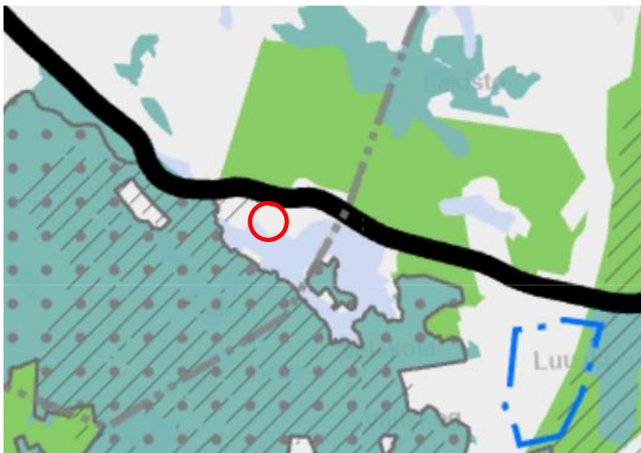
Kuva 2. Ote maakuntakaavojen epävirallisesta yhdistelmästä (Uudenmaan liiton tulkinta 11.11.2021). Suunnittelualueen likimääräinen sijainti on esitetty punaisella ympyrällä

Voimassa olevien maakuntakaavojen epävirallisessa yhdistelmässä suunnittelualueen läheisyydessä sijaitseva Nuuksio on merkitty Natura 2000 -verkostoon kuuluvana tai ehdotettuna alueena (pallorasteri, Uudenmaan maakuntakaava). Lisäksi Nuuksio on esitetty luonnonsuojelualueena (turkoosi alue, Uudenmaan 4. vaihemaakuntakaava). Lähimmillään suunnittelualueen länsipuolelle sijoittuu arvokas geologinen muodostuma (vinoviivitus, Helsingin seudun vaihemaakuntakaava). Lisäksi alueen pohjoispuolelle on merkitty virkistysalue Vaakkoi (vihreä alue, Helsingin seudun vaihemaakuntakaava).