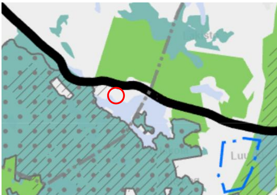
Kuva 2. Ote maakuntakaavojen epävirallisesta yhdistelmästä (Uudenmaan liiton tulkinta 11.11.2021). Suunnittelualueen likimääräinen sijainti on esitetty punaisella ympyrällä

Voimassa olevien maakuntakaavojen epävirallisessa yhdistelmässä suunnittelualueen läheisyydessä sijaitseva Nuuksio on merkitty Natura 2000 -verkostoon kuuluvana tai ehdotettuna alueena (pallorasteri, Uudenmaan maakuntakaava). Lisäksi Nuuksio on esitetty luonnonsuojelualueena (turkoosi alue, Uudenmaan 4. vaihemaakuntakaava). Lähimmillään suunnittelualueen länsipuolelle sijoittuu arvokas geologinen muodostuma (vinoviiivoitus, Helsingin seudun vaihemaakuntakaava). Lisäksi alueen pohjoispuolelle on merkitty virkistysalue Vaakkoi (vihreä alue, Helsingin seudun vaihemaakuntakaava).