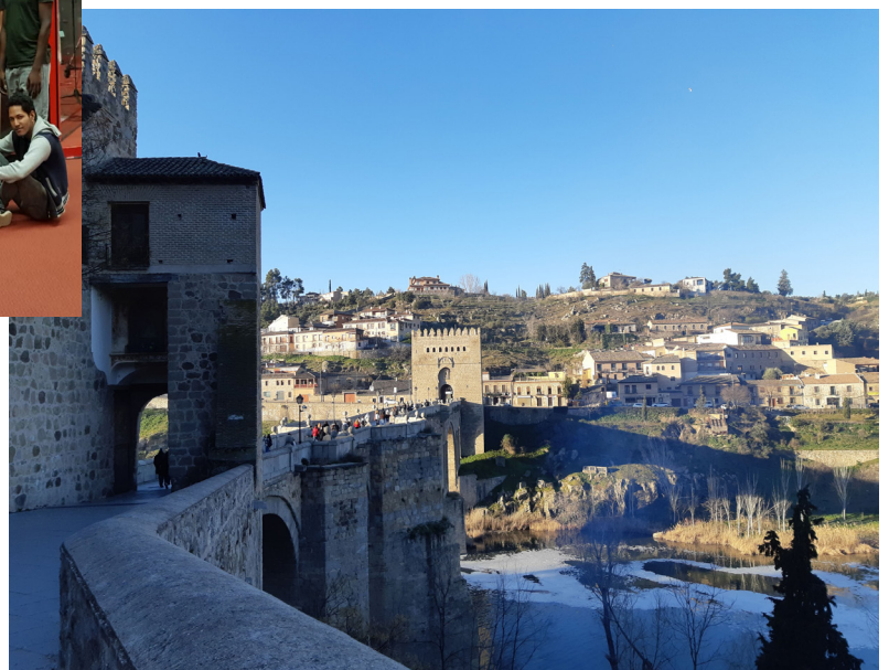
Espanjan leirikoululaisia matkalla koululta bussipysäkillä Toledossa.