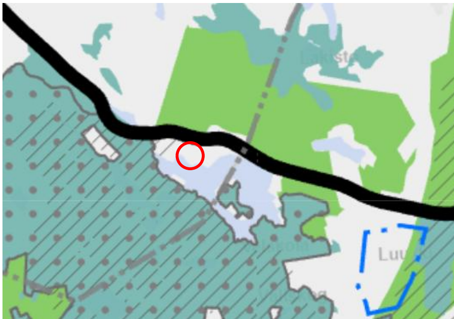
Kuva 2. Ote maakuntakaavojen epävirallisesta yhdistelmästä (Uudenmaan liitto). Suunnittelualueen likimääräinen sijainti on esitetty punaisella ympyrällä

Maakuntakaavassa suunnittelualueen läheisyydessä sijaitseva Nuuksio on merkitty Natura 2000 -verkostoon kuuluvana tai ehdotettuna alueena (pallorasteri, Uudenmaan maakuntakaava). Lisäksi Nuuksio on esitetty luonnonsuojelualueena (turkoosi alue, Uudenmaan 4. vaihemaakuntakaava). Lähimmillään suunnittelualueen länsipuolelle sijoittuu arvokas geologinen muodostuma (vinoviivitus, Helsingin seudun vaihemaakuntakaava). Lisäksi alueen pohjoispuolelle on merkitty virkistysalue Vaakkoi (vihreä alue, Helsingin seudun vaihemaakuntakaava).