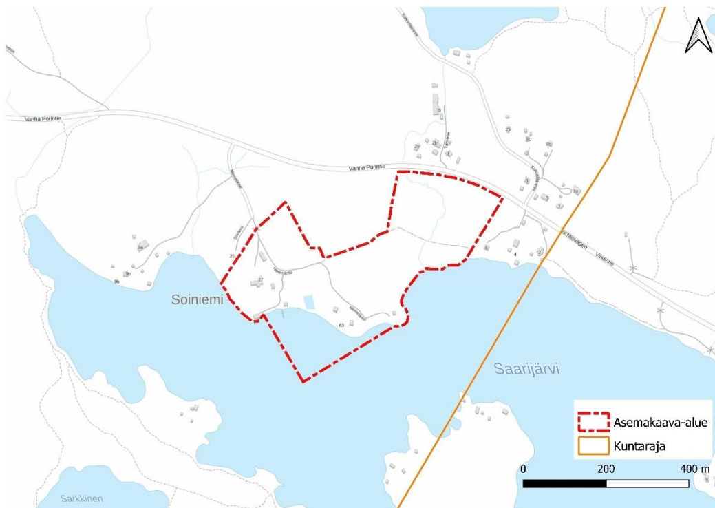
Kuva 1. Alustavan kaava-alueen sijainti (Maanmittauslaitos 2021).

Suunnittelualue sijoittuu Vihdin kunnan kaakkoisosaan Saarijärven pohjoisrannalle. Suunnittelualue on lähimmillään alle 200 metrin etäisyydellä Espoon kaupungin rajasta. Kuntaraja kulkee Saarijärven halki koillis-lounaissauntaisesti. Suunnittelualue käsittää kiinteistöt 927-430-2-4, 927-430-2-106 ja 927-430-2-108. Alue rajautuu koillisosasta maantiehen, etelässä vesialueeseen ja muilta osin vireisiin kiinteistöihin. Nuuksion kansallispuisto rajautuu Saarijärven lounaassa. Alueen pohjoispuolella kulkee Vanha Porintie (tie 120) ja alueelta on matkaa Otalammen taajamaan noin 11 km. Suunnittelualueen pinta-ala on noin 15,7 hehtaaria. Alue on kokonaan yksityisessä omistuksessa. Kaavan mitoitustarkasteluissa huomioidaan myös samaan kokonaisuuteen kuuluva, Vanhan Porintien pohjoispuolella sijaitseva, kiinteistö 927-430-2-45.