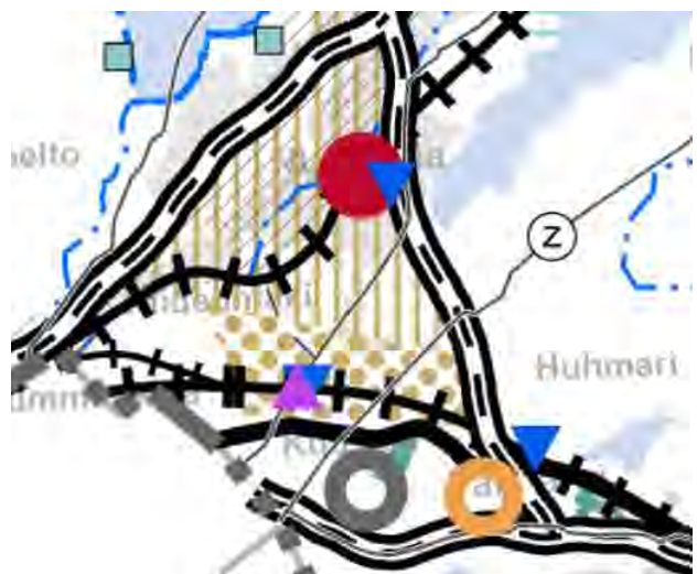
Kuva 3 Ote Helsinginseudun maakuntakaavasta Nummelan kohdalta. © Uudenmaanliitto

Uusimaa-kaavan 2050 aineistoon voi tutustua tarkemmin Uudenmaanliiton sivuilla: https://uudenmaanliitto.fi/kaavoitus-ja-liikenne/maakuntakaavat/uusimaa-kaava-2050/