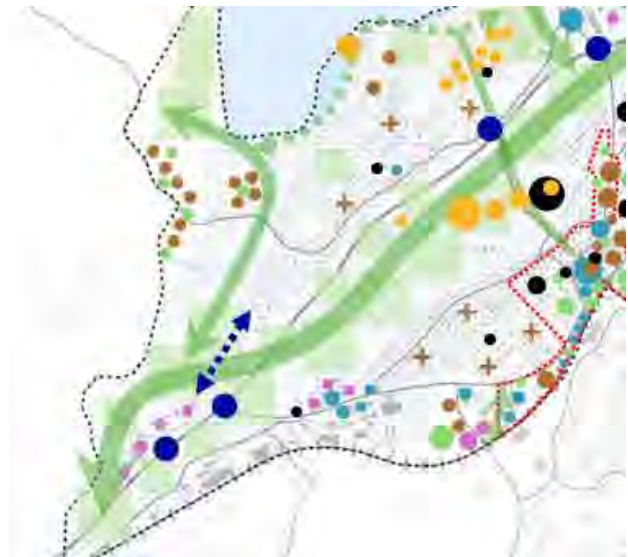
Kuva 4 Ote Nummelan osayleiskaavan luonnoksesta VE1.