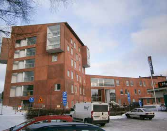
Järvenpään on valmistumassa energiatehokas ja maalämmöllä lämpenevä palvelutalo Vaahterakoti.

Järvenpään Jampassa on rakenteilla Järvenpään Mestariasuntojen ja Järvenpään kaupungin yhteishankkeena suunnittelema 74 asunnon Vaahterakoti. Kyseessä on senioreille tarkoitettu palvelutalo, jonka kaikki asunnot tulevat kaupungin järjestämän ympärivuorokautisen hoivapalvelun piiriin. Vaahterakoti on suunniteltu matalaenergiakerrostaloksi, ja rakennuksen lämmönlähteeksi tulee maalämpö. Rakennushanke aloitettiin syksyllä 2015, ja kohteen arvioitu valmistumisaika on keväällä 2017. Ensimmäiset asukkaat muuttivat Vaahterakotiin kuitenkin ja vuoden 2016 lopussa.