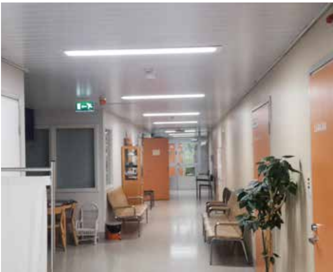
Pornaisten terveyskeskuksen sisävalaistus uusittiin koko rakennuksen osalta energiatehokkailla LED-valaisimilla