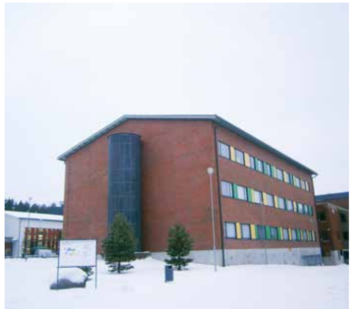
Nummelanharjun koulukeskus Vihdin Nummelassa sekä sen vieressä oleva uimahalli siirrettiin öljylämmityksestä hakelämpöön. Jatkossa uusiutuvan energian osuutta rakennusten lämmityksessä on tavoitteena Vihdissä lisätä edelleen.