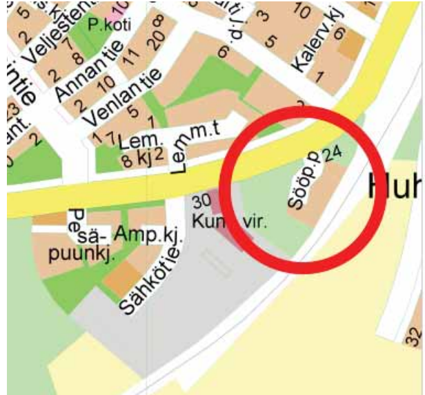
Kaavamuutosalueen alustava sijainti (rajattu punaisella) opaskartalla