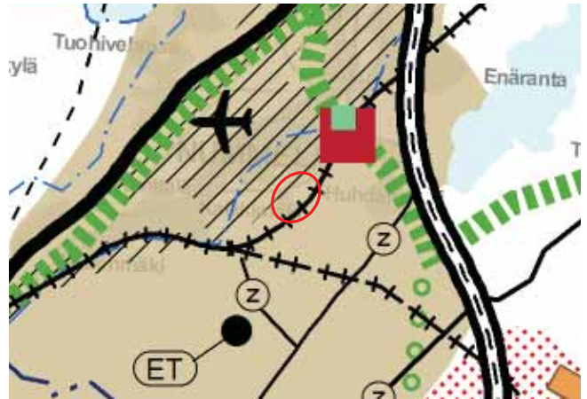
Kaavamuutosalueen alustava sijainti (rajattu punaisella) Uudenmaan maakuntakaavalla.