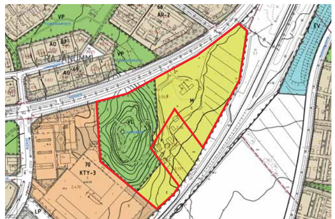
Kaavamuutosalueen alustava rajaus (rajattu punaisella) ajantasajamakaavalla.