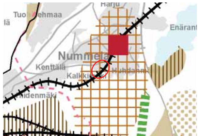
Kaavamuutosalueen alustava sijainti (rajattu punaisella) 2. vaihemaakuntakaavalla.