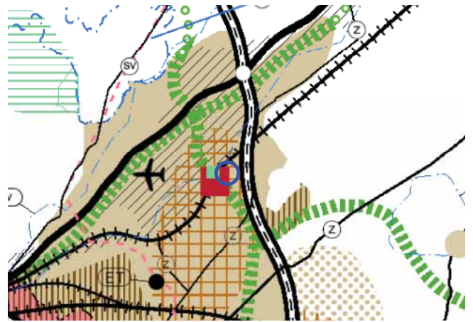
Kaavamuutosalueen alustava sijainti (rajattu sinisellä) Uudenmaan maakuntakaavojen epävirallisella yhdistelmäkartalla.