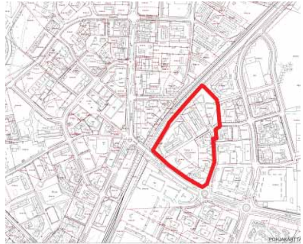
Kaavamuutosalueen alustava sijainti (rajattu punaisella) opaskartalla ja kantakartalla

Suunnittelualue on kokonaisuudessaan rakennettua ympäristöä. Alue on pääosin rakentunut voimassa olevien asemakaavojen mukaisesti, mutta alueella on jonkin verran toteutumattomia rakennusoikeutta. Voimassa olevat asemakaavat mahdollistavat kaksi suoraa tonttiliittymää Meritieltä kaavamuutosalueelle. Meritie on yksi Nummelan taajaman merkittävimmistä pääkaduista, ja sen vuorokausiliikenne on noin 11 400 - 15 000 autoa/vrk (Pöyry Finland Oy, 2011).