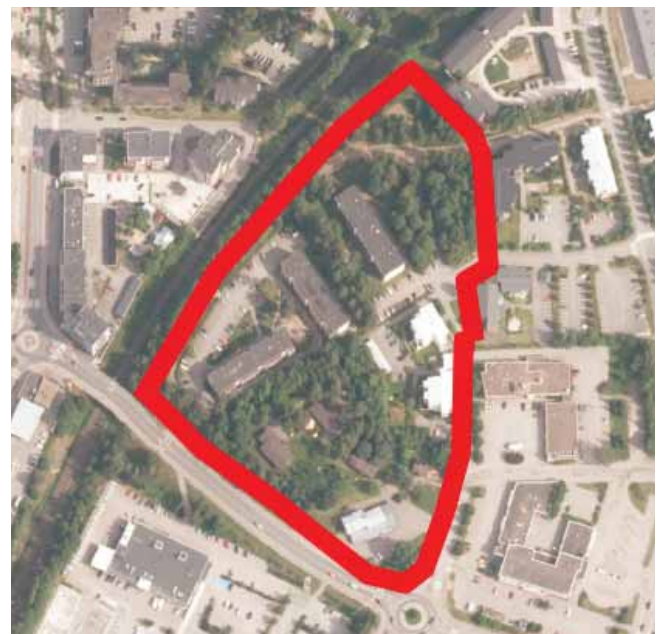
Kaavamuutosalueen alustava sijainti (rajattu punaisella) ilmakuvalla