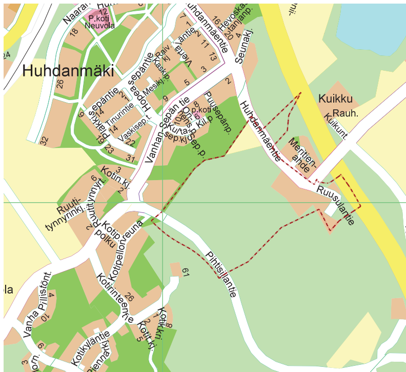
Kaava-alueen alustava sijainti (rajattu punaisella) opaskartalla

Perusselvitykset ja tavoitteet -raportti havainnollistaa kaavatyön lähtökohtia ja se laaditaan kaavatyön vireilletulon jälkeen. Tässä tapauksessa raportti on laadittu jo kaavan N 148 yhteydessä ja tällä tavoiteraportilla tarkennetaan tavoiteasettelu kaavan N 175 osalta.