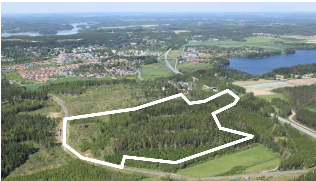
Suunnittelualueen likimääräinen raja viistokuvassa.

Perusselvitykset ja tavoitteet -raportti havainnollistaa kaavatyön lähtökohtia ja se laaditaan kaavatyön vireilletulon jälkeen. Tässä tapauksessa raportti on laadittu jo kaavan N 148 yhteydessä ja tällä tavoiteraportilla tarkennetaan tavoiteasettelu kaavan N 176 osalta.