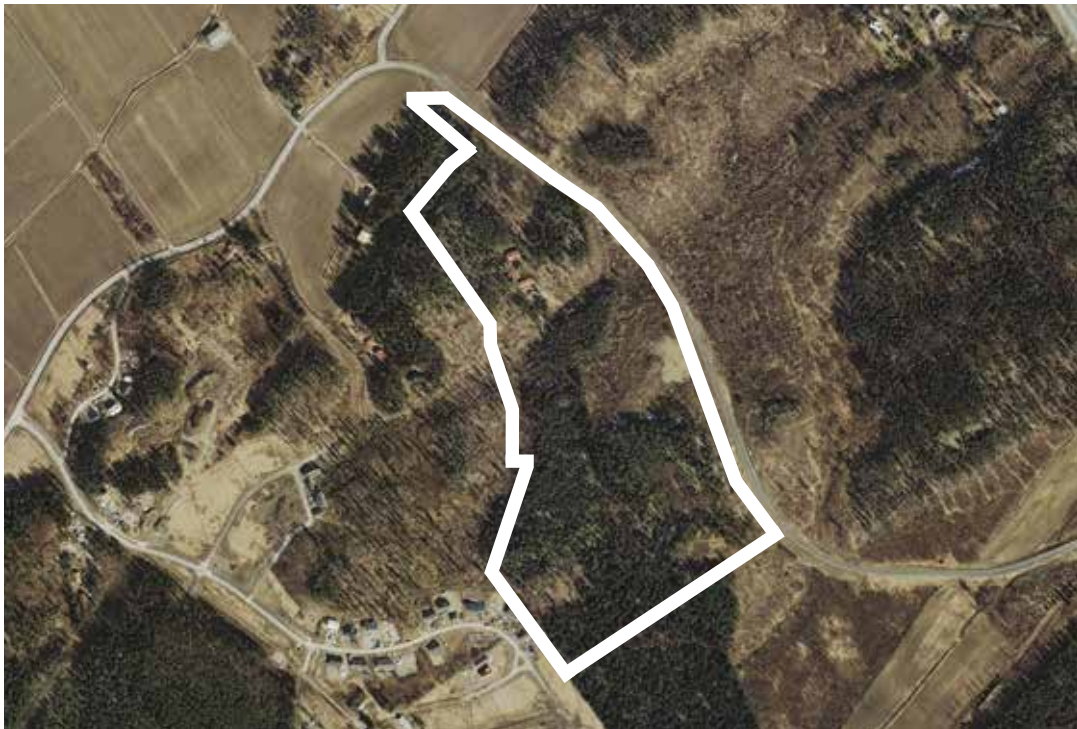
Suunnittelualan alustava rajausta (valkoisella) ortokuvassa.

Perusselvitykset ja tavoitteet -raportti havainnollistaa kaavatyön lähtökohtia ja se laaditaan kaavatyön vireilletulon jälkeen. Tässä tapauksessa raportti on laadittu jo kaavan N 148 yhteydessä ja tällä tavoiteraportilla päivitetään tavoiteasettelu kaavan N 177 osalta.