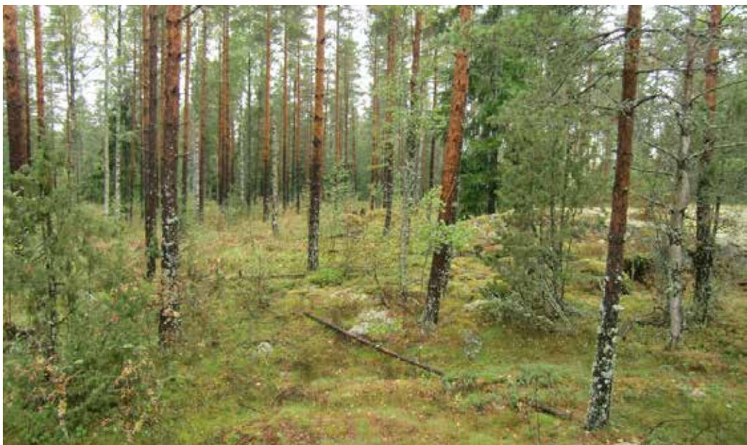
Kuvassa alueen eteläosan luontoa. Luontoarvot ja maastonmuodot asettavat reunaehdoita suunnittelulle.

Helsingin seutua kehitetään kansainvälisesti kilpailukykyisenä valtakunnallisena pääkeskuksena luomalla edellytykset riittävälle ja monipuoliselle asunto- ja työpaikkarakentamiselle, toimivalle liikennejärjestelmälle sekä hyvälle elinympäristölle. Helsingin seudulla edistetään joukkoliikenteeseen, erityisesti raideliikenteeseen tukeutuvaa ja eheytyvää yhdyskuntarakennetta.