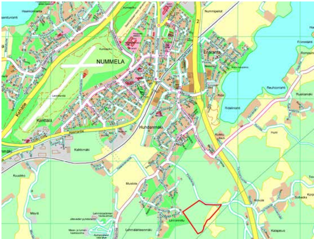
Suunnittelualan alustava rajaus (rajattu punaisella) Vihdin kunnan opaskartalla.

Perusselvitykset ja tavoitteet -raportti havainnollistaa kaavatyön lähtökohtia ja se laaditaan kaavatyön vireilletulon jälkeen. Tässä tapauksessa raportti on laadittu jo kaavan N 148 yhteydessä ja tällä tavoiteraportilla päivitetään tavoiteasettelu kaavan N 178 osalta.