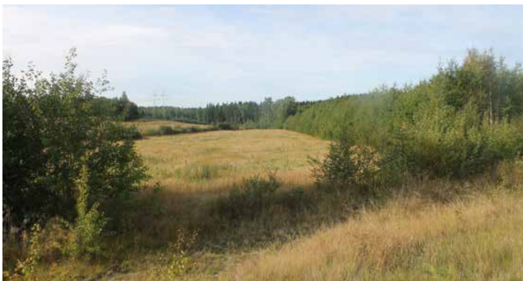
Kuvassa suunnittelualue nykytilassa. Kuva otettu suunnittelualueen itäosasta, Pihtisillantieltä katsottuna.

Hakalanrinteen alueen kaavoituksen myötä Nummelan taajama-alueelle muodostuu uusia pientalotontteja. Alue sijoittuu lähelle olemassa olevaa Nummelan taajamaa, jatkaen taajamarakennetta etelään. Alustavien yleissuunnitelmien mukaan tuleva Länsiradan/ESA-rata ja Höytiönnummen rautatieasema sijoittuvat suunnittelualueen lounaispuolelle.